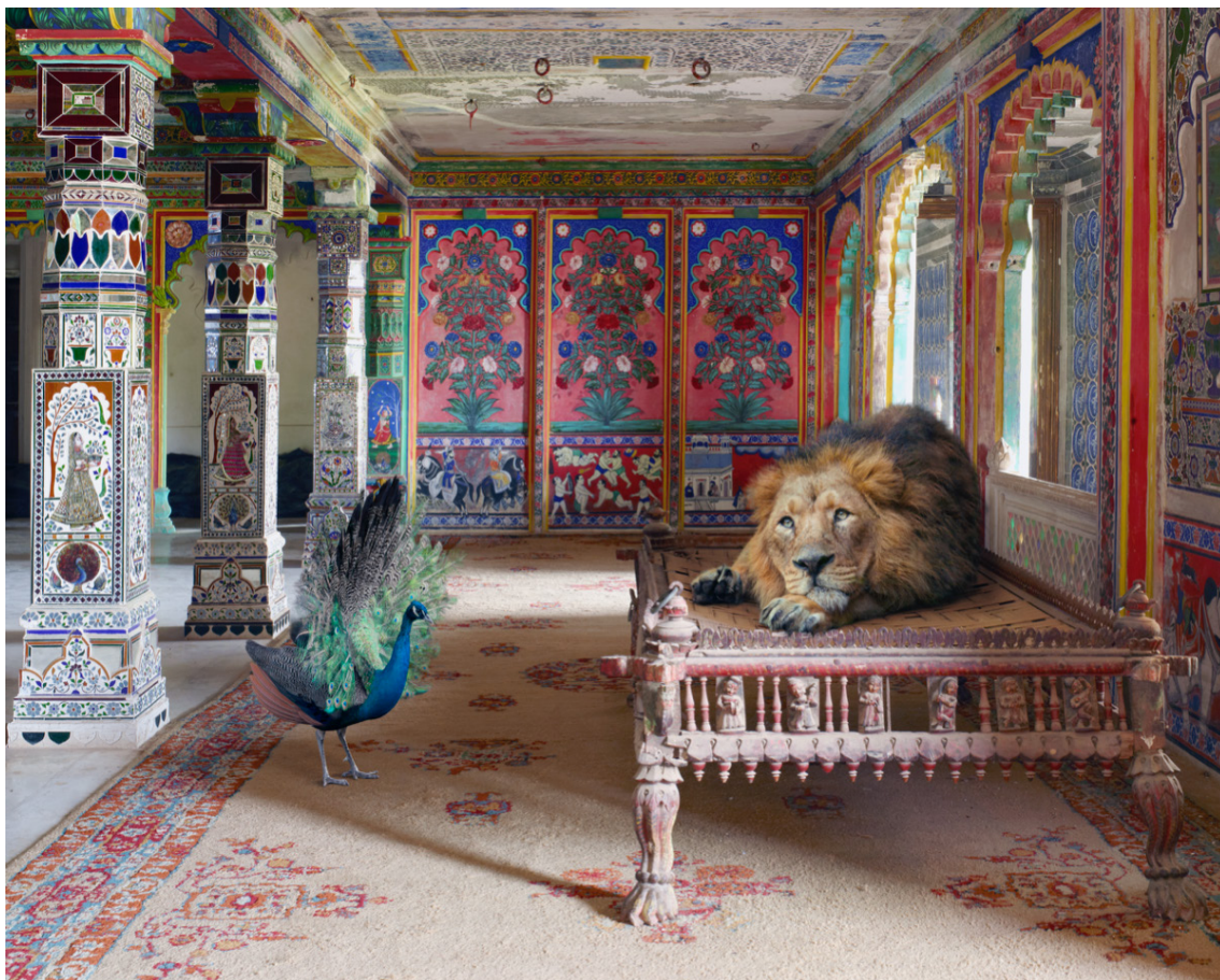
The Lovesick Prince, © Karen Knorr - Courtesy Galerie Les filles du calvaire, Paris.