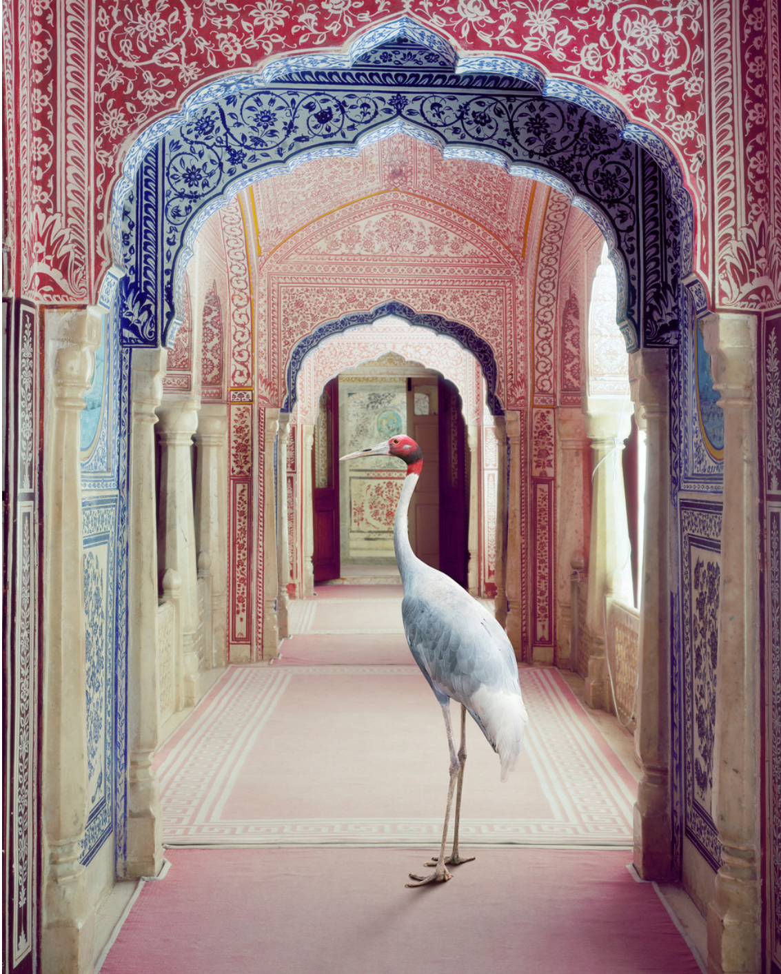
A Faithful Companion , Samode Palace, 2020