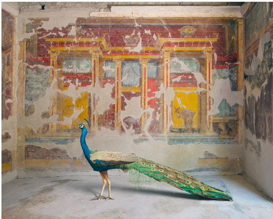
Hera's Eyes, Villa Oplontis © Karen Knorr - Courtesy Galerie Les filles du calvaire, Paris.