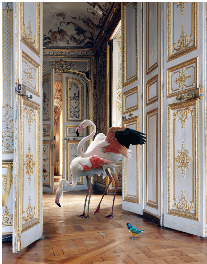
The Grand Monkey Room (2) (Musée Condé, Chantilly), 2006. Série « Fables »

Chaque image est un voyage, un conte visuel où l'art et la culture s'animent à travers des photographies qui interrogent, étonnent et fascinent.