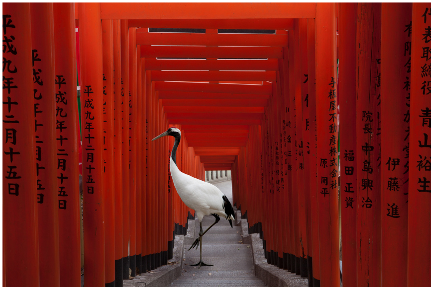
The Journey, Hie Torii, Tokyo, 2015 © Karen Knorr - Courtesy Galerie Les filles du calvaire, Paris.