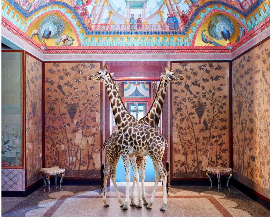
Brief Encounter, Palazzina Cinese, 2018 © Karen Knorr - Courtesy Galerie Les filles du calvaire, Paris.