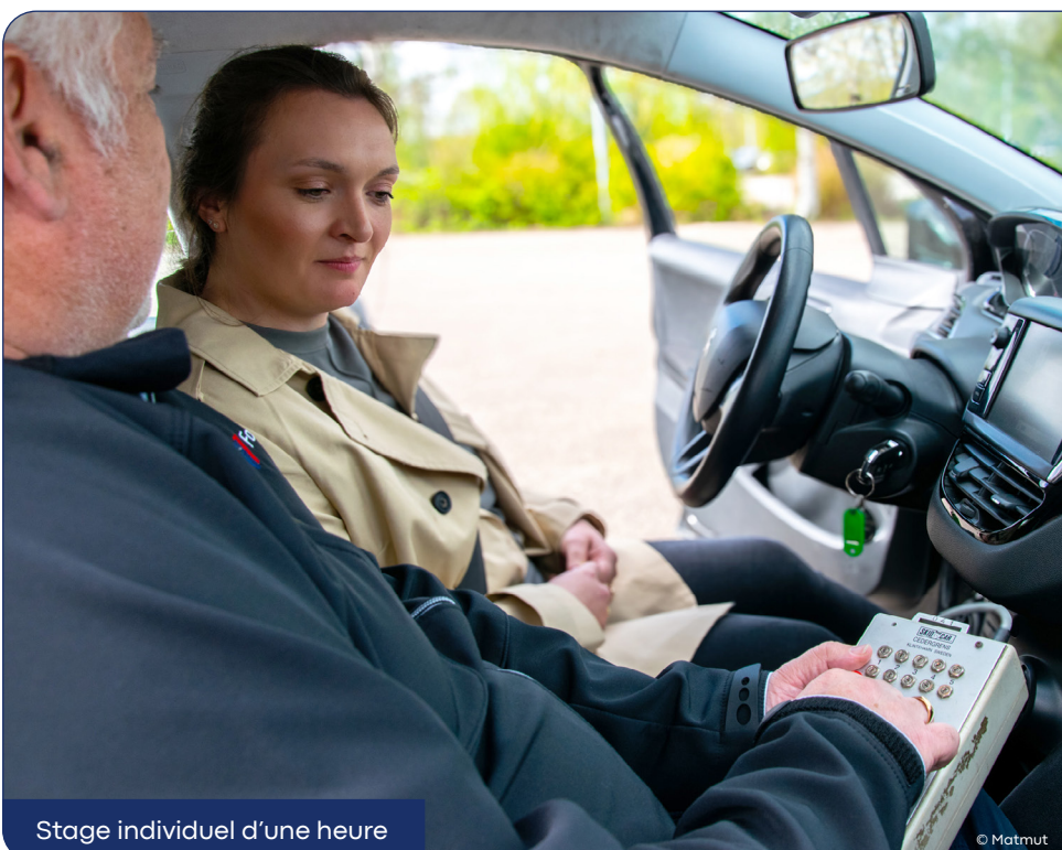
Stage individuel d'une heure

* Source : Observatoire national interministériel de la sécurité routière bilan 2023.