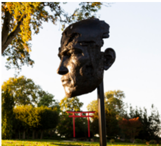
Tête de Persée monumentale Christophe Charbonnel