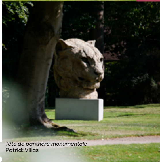
Tête de panthère monumentale Patrick Villas