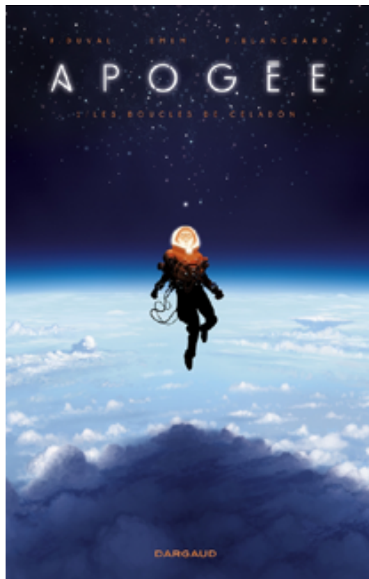
Apogée tome 1 – Les boucles du Celadon

Au travers d'une sélection de planches, maquettes, éléments de décor et la scénographie, le parcours de l'exposition abordera les secrets de fabrication de ces bandes dessinées (inspirations, scénario, storyboard, dessins, encrage, colorisation) en présentant le rôle complémentaire de ces trois acteurs.