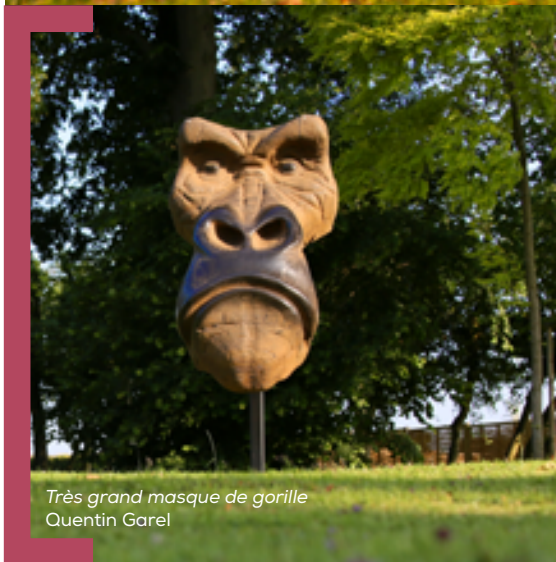
Très grand masque de gorille Quentin Garel