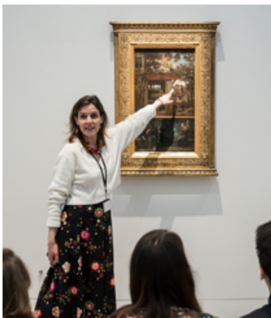
Mondes Souterrains

21 projets autour de l'accessibilité ont ainsi été soutenus en 2025. Ils auront permis le déploiement d'outils de médiation adaptés aux différents publics comme une maquette tactile au Théâtre des Célestins à Lyon, des cartels universels et FALC dans le cadre des expositions du Louvre Lens ou du Grand Palais ou encore des visites en langue des signes française assurées au Consortium Museum de Dijon. Les personnes en situation de handicap sont aussi au cœur du programme d'accessibilité du nouveau mécéné Théâtre du Châtelet tandis que le public incarcéré peut compter sur les spectacles hors les murs