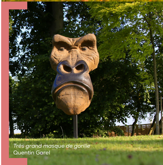
Très grand masque de gorille Quentin Garel