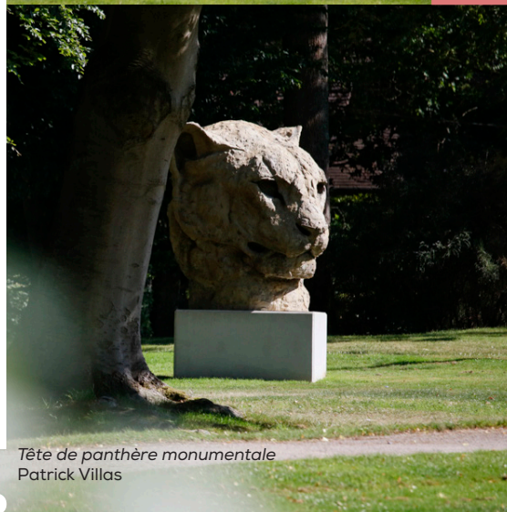
Tête de panthère monumentale Patrick Villas