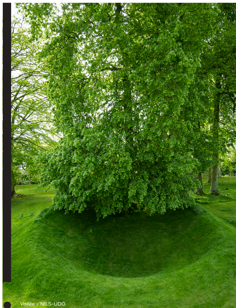
Vallée - NILS-UDO

NILS-UDO est un artiste profondément attaché à la nature, son environnement de travail privilégié. Après sa visite du parc et du Centre d'art contemporain de la Matmut - Daniel Havis à l'été 2017, il a souhaité intervenir autour du tilleul près de la chapelle afin de créer une œuvre intitulée Vallée . Son œuvre est constituée de courbes qui entourent le tilleul et viennent en contraste avec la plénitude et le classicisme du parc. Avec 2 m de profondeur à l'avant et de hauteur à l'arrière, un col se dessine autour de l'arbre.