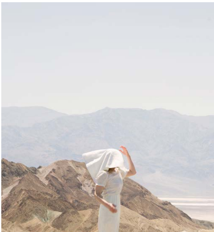
© Maia Flore, Death Valley , 2017