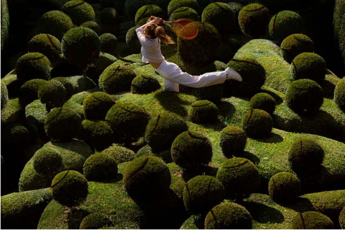
© Maïa Flore, Côte court, 2023