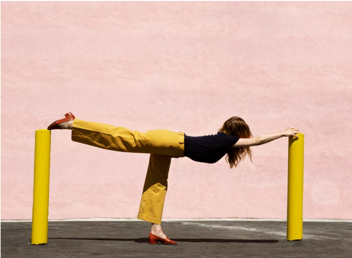
© Maïa Flore, How to park in Los Angeles, 2018