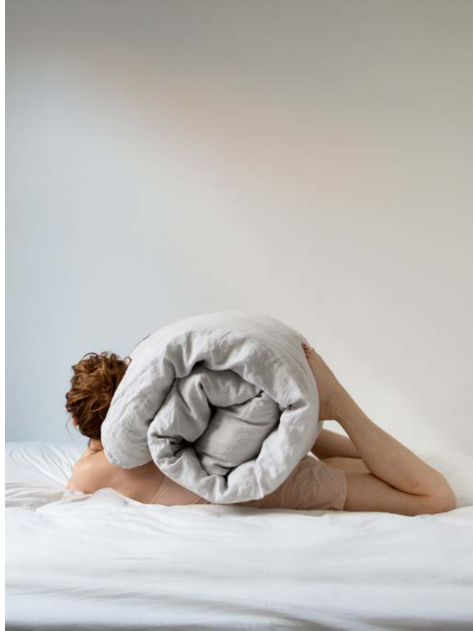
© Maia Flore, Slow Life , 2020