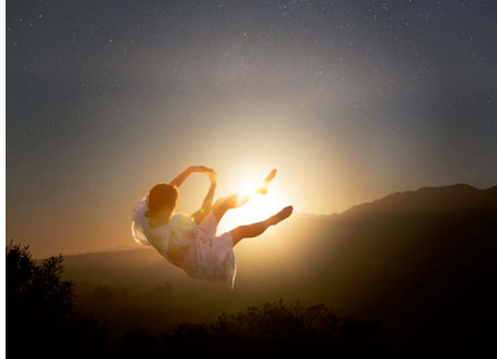
© Maïa Flore, Couché du soleil, 2021