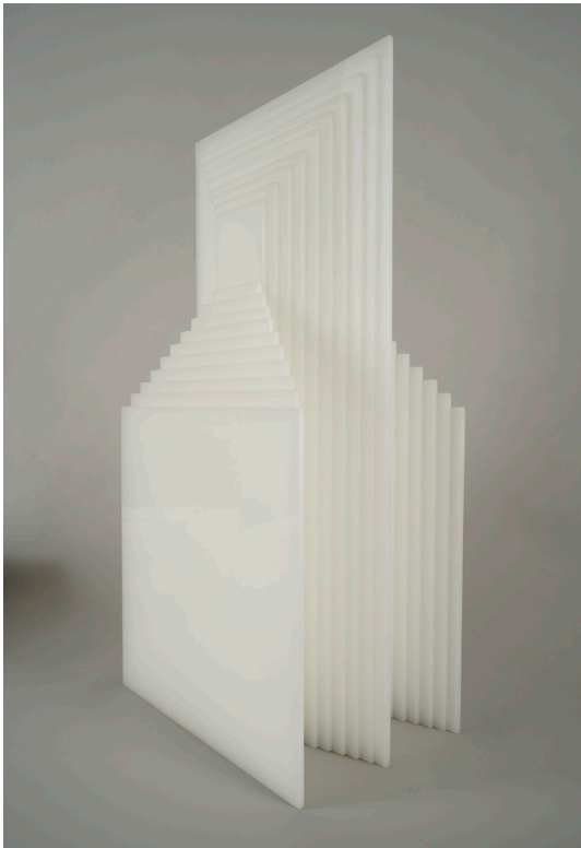
Carré en progression Acrylique blanc sur 5 mm - 60 x 60 x 20 cm 1971-2001