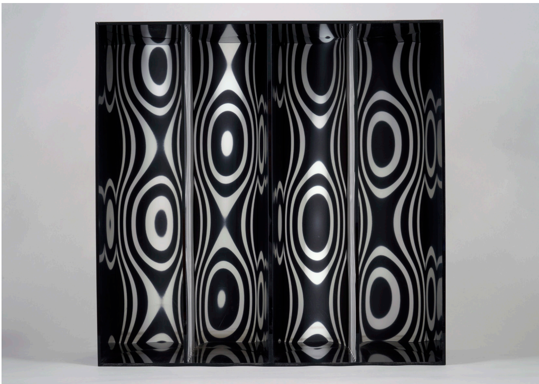
Ondes par déplacement du spectateur - Métal - Impression - 50 x 50 x 16 cm - 1965-2012