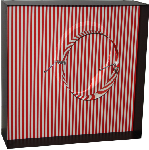
Cercle en contorsion sur trame rouge Métal - Moteur - Sérigraphie 60 x 60 x 17 cm