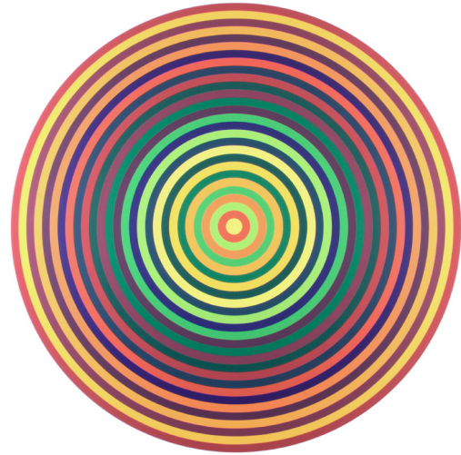
Surface-Couleur Série 23 N°13-11 - Acrylique sur toile 200 x 200 cm - 1990-1992