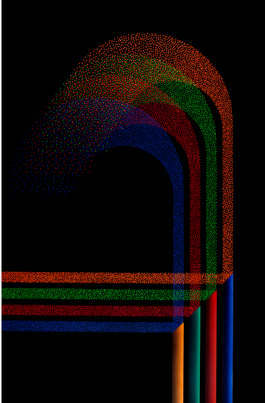
Alchimie 208 Acrylique sur toile - Partie 3 d'un triptyque - 195 x 390 cm 1990-1992