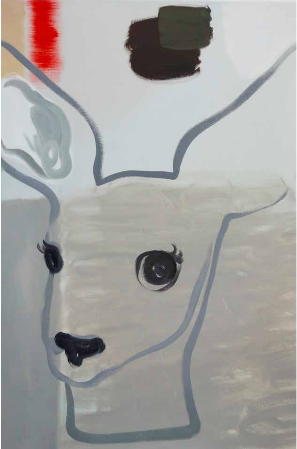
Françoise Pérovitch - Sans titre , 2018 Huile sur toile - 116 x 89 cm Courtesy Semiose, Paris © A. Mole