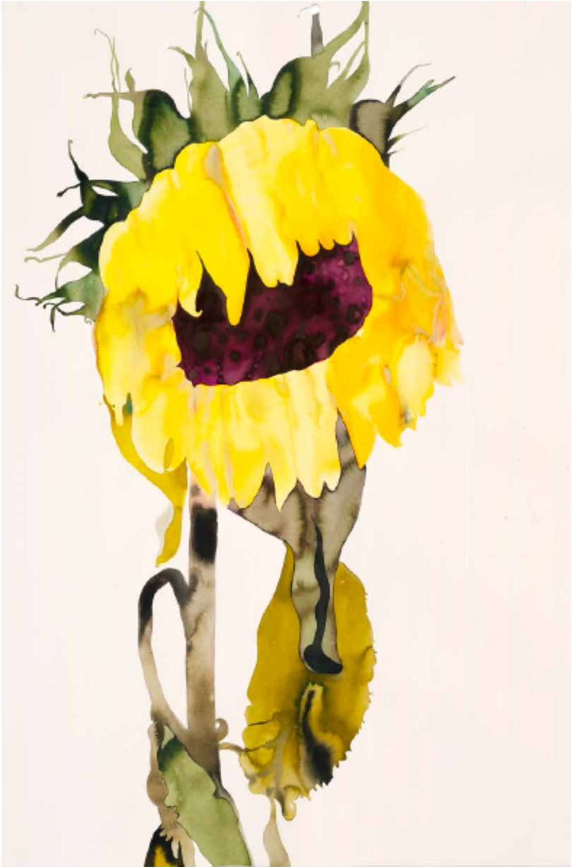
Françoise Pérovitch - Sans titre , 2016 Lavis d'encre sur papier - 160 x 120 cm