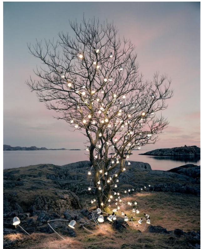
The heirs motivational speech

Cette exposition est réalisée dans le cadre de « Lumières Nordiques : un parcours photographique en Normandie ».