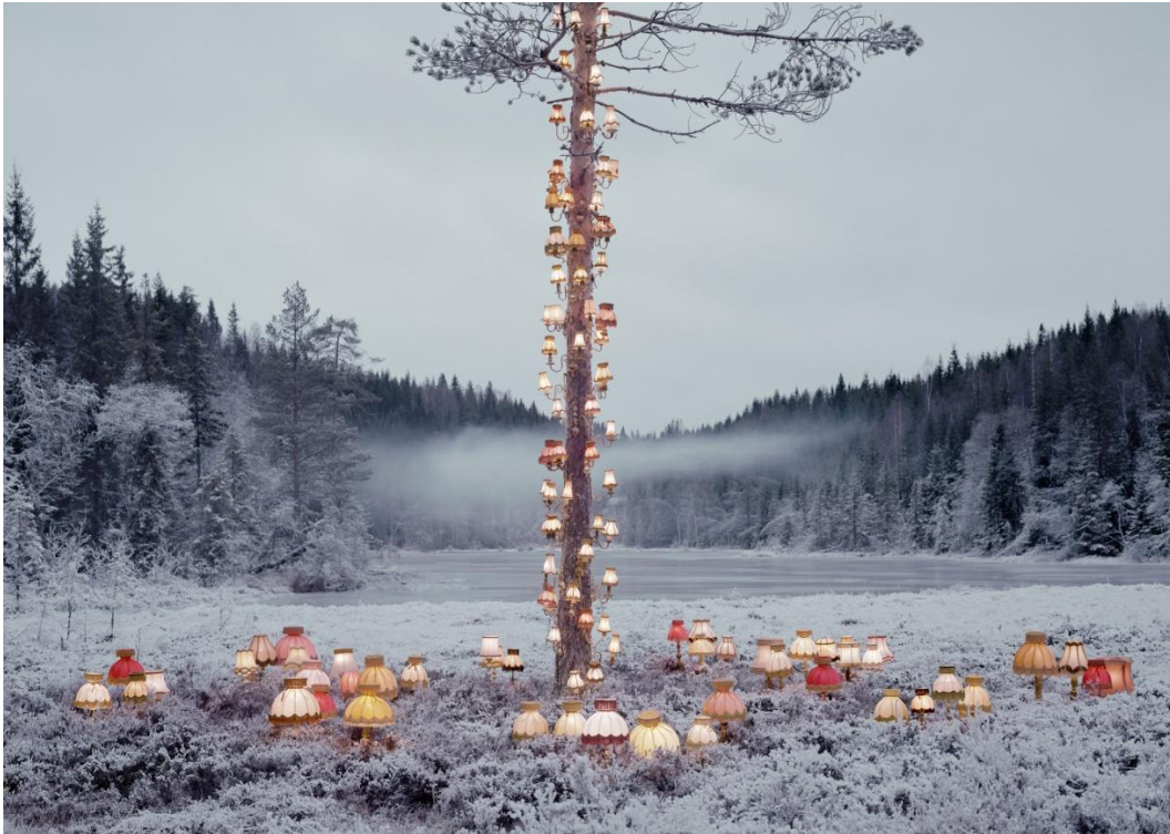
At no time defeat sunrise