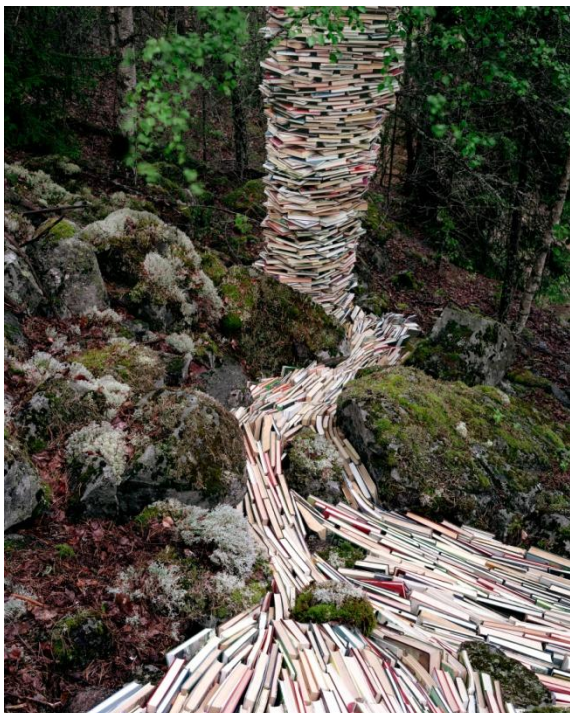
Aftermath of habitual argument