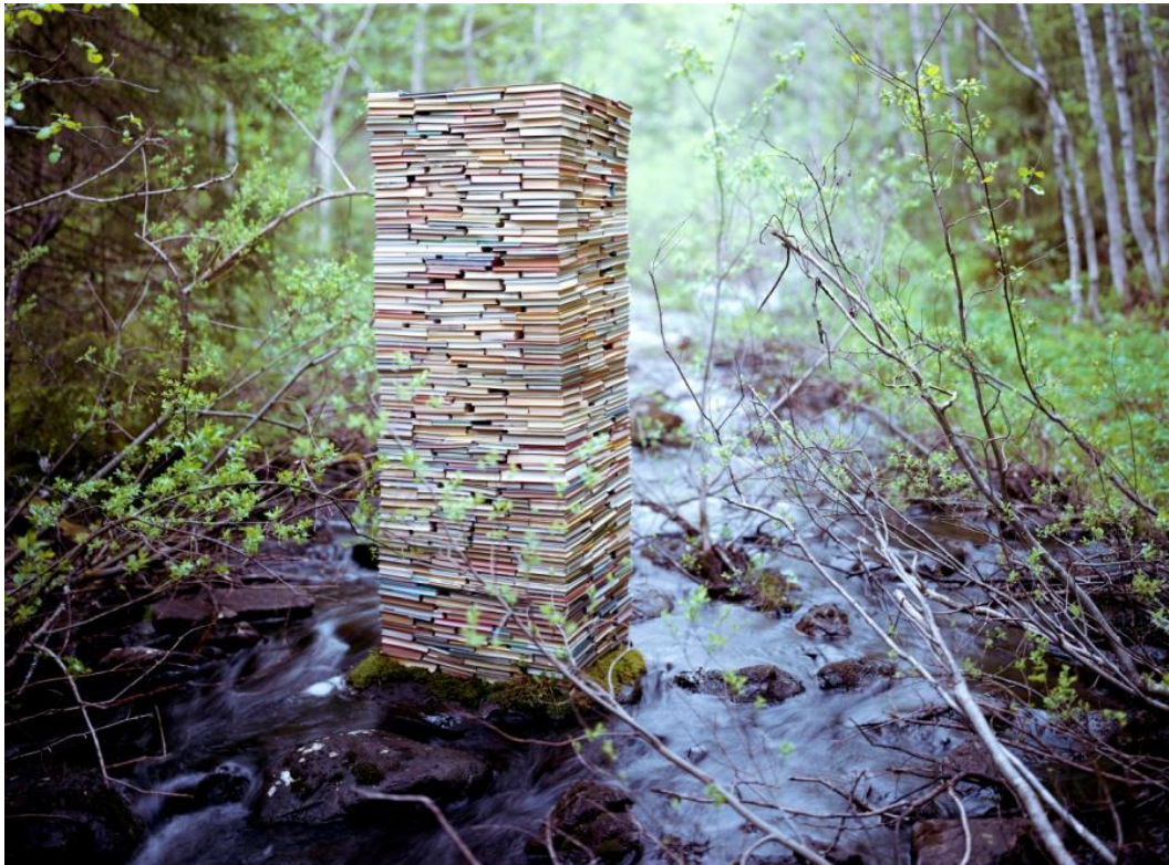
Second system of ethics