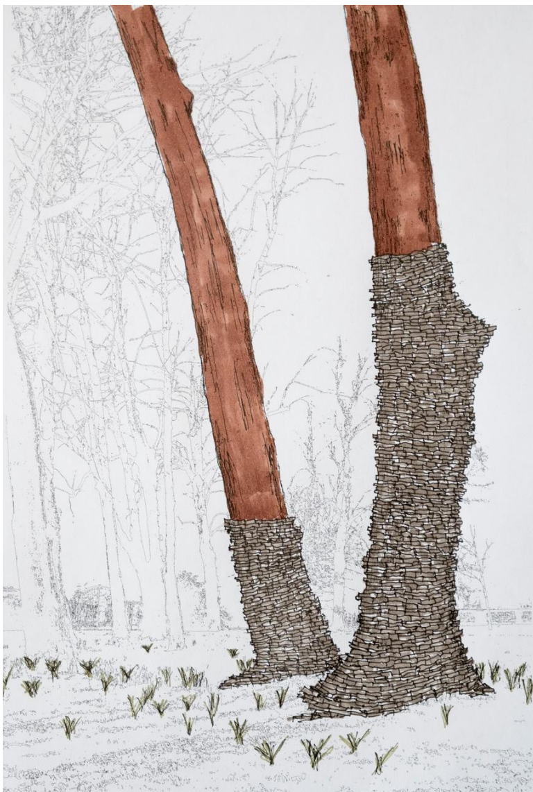
Projet d'installation dans le parc du Centre d'Art Contemporain de la Matmut, par Rune Guneriusen.

Les salariés de la Matmut ont également été impliqués. Chaque participant a ainsi offert une seconde vie aux livres en leur permettant de devenir une partie de la future installation de Rune Guneriusen.