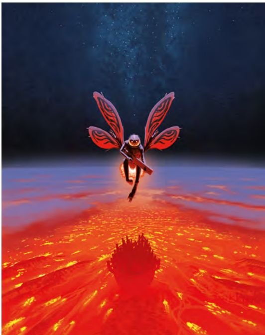
La Forge de Nacärä , F. Duval, F. Blanchard, EMEM © Éditions Dargaud, 2026