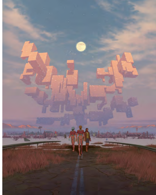
Interzone , F. Duval, F. Blanchard, EMEM © Éditions Dargaud