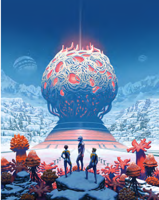
Les Hybrides , F. Duval, F. Blanchard, EMEM © Éditions Dargaud