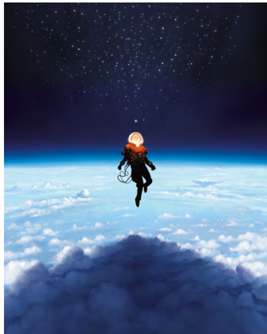
Apogée Tome 1 , F. Duval, F. Blanchard, EMEM © Éditions Dargaud, 2026