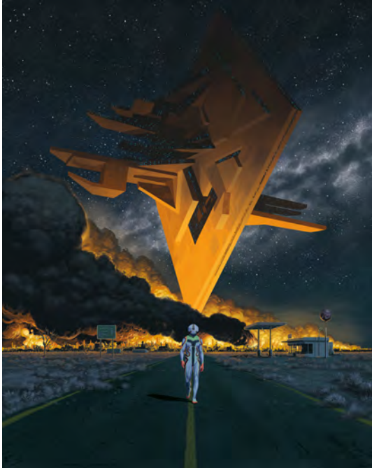
Les Déracinés , F. Duval, F. Blanchard, EMEM © Éditions Dargaud