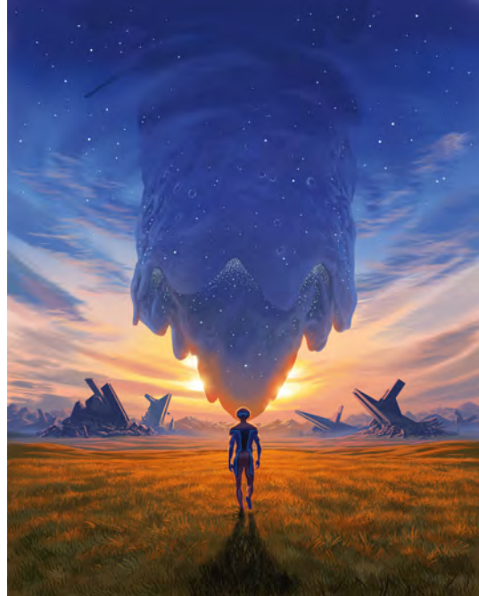
Les Ouroboros , F. Duval, F. Blanchard, EMEM