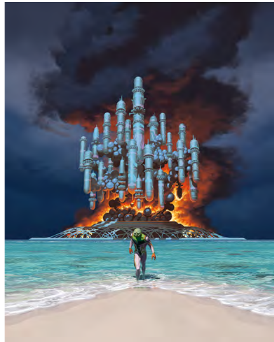
Sui Juris , F. Duval, F. Blanchard, EMEM © Éditions Dargaud