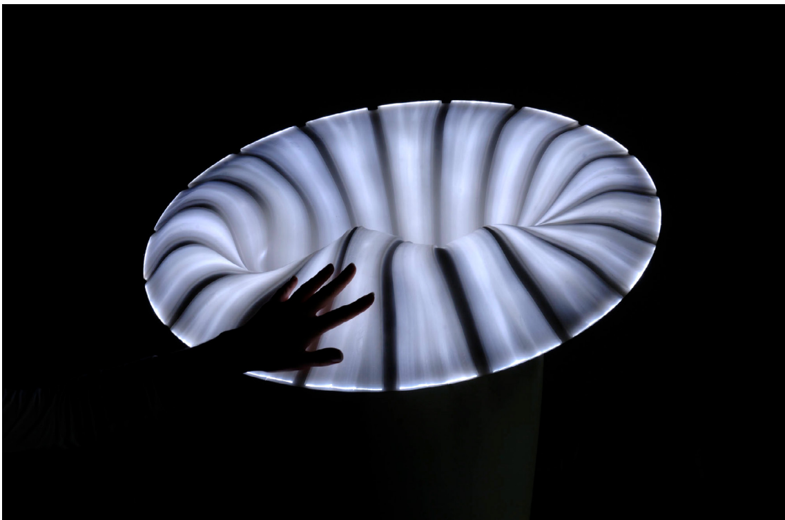
© Bina Baitel, Luminaire Pull-Over , photo : Marie Flores.