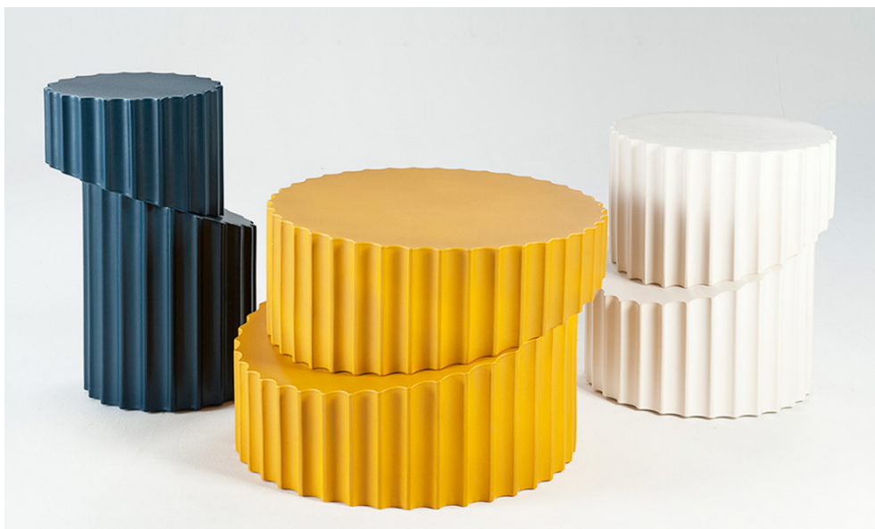
© Bina Baitel, Doric Roche Bobois - Side-table .