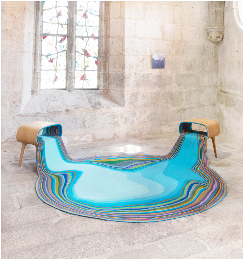
© Bina Baitel, Confluencia Aubusson .