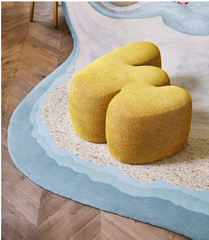
© Bina Baitel, Zigzag Ottoman