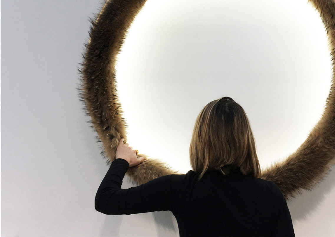
© Bina Baitel, Fur-light , photo Bina Baitel Studio.