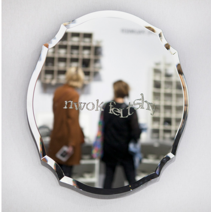
© Bina Baitel, Captcha Mirror , photo Gilad Sasporta.