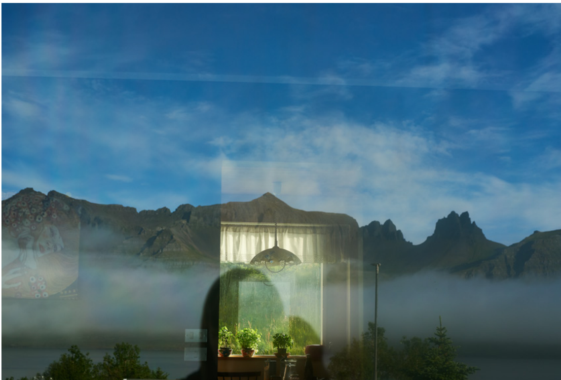
Stöðvarfjörður, Islande, août 2021