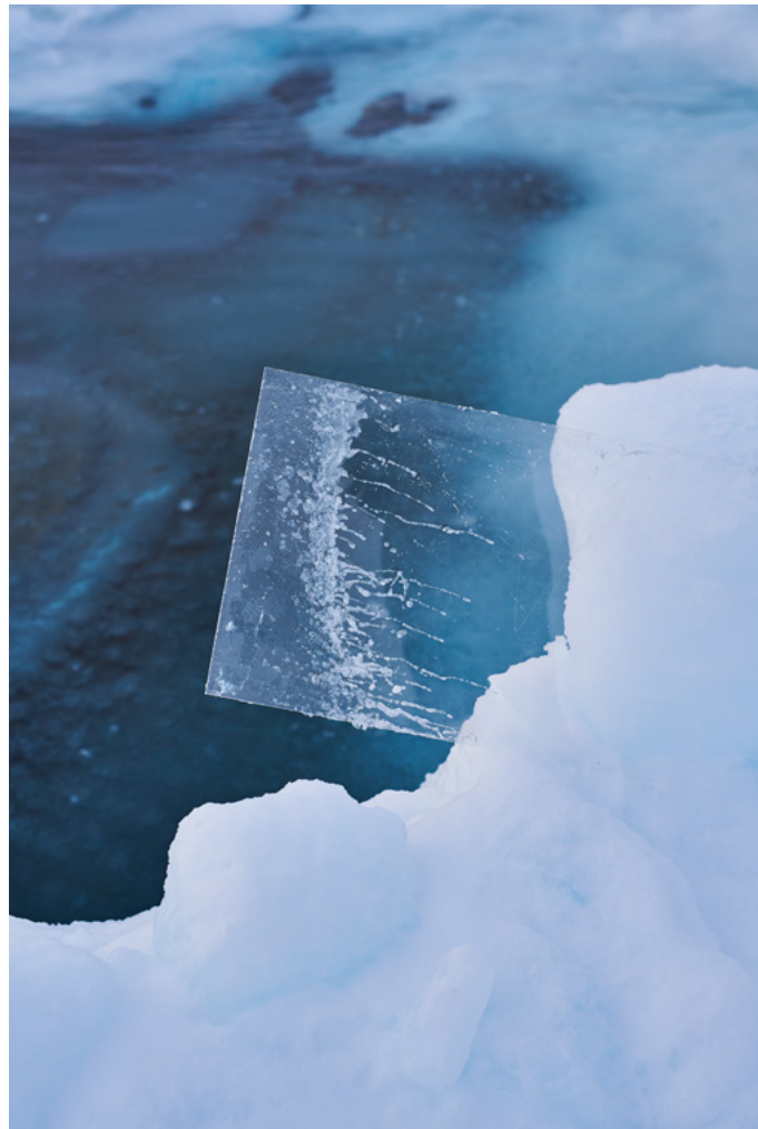
Oqaasut, Groenland, mars 2022 - © Anna Lehespalu