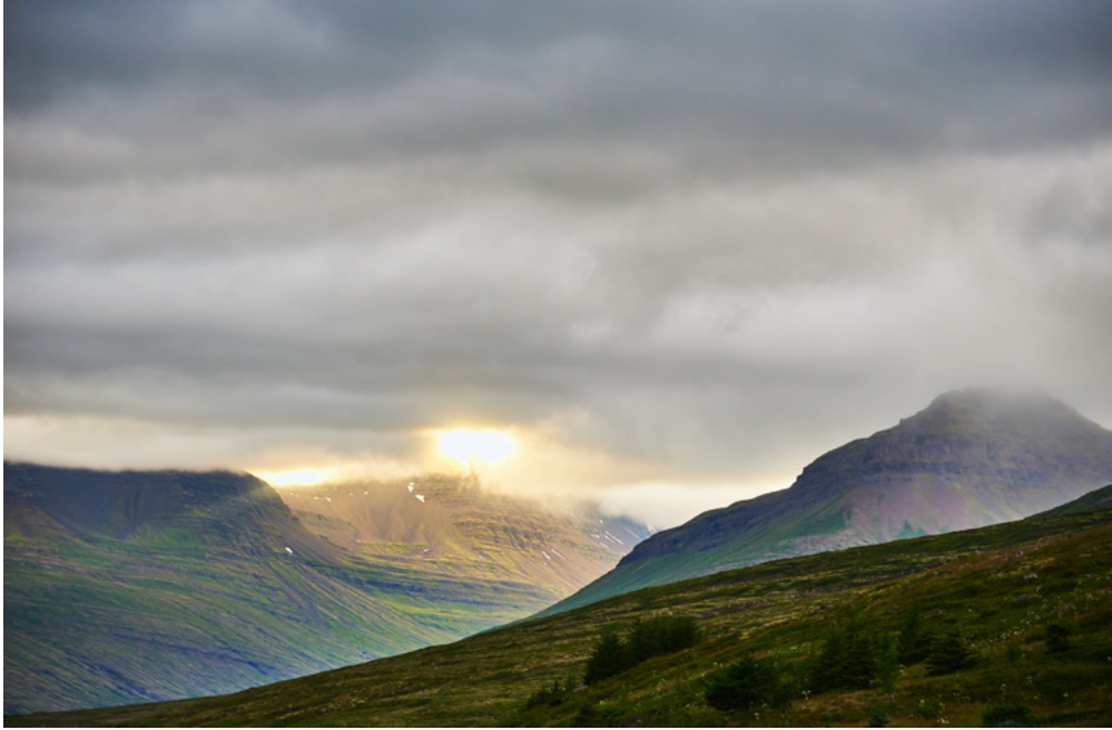
Stöðvarfjörður, Islande, août 2021