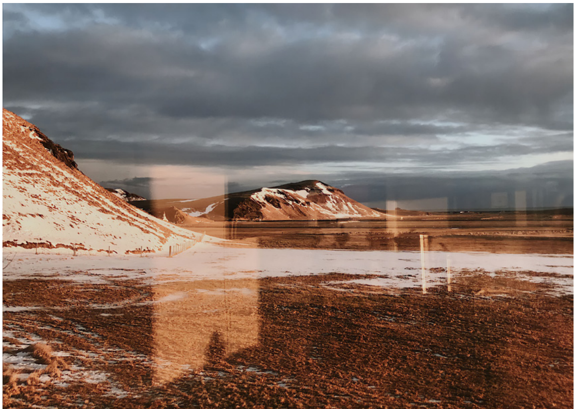
Vík í Mýral, Islande, mars 2020