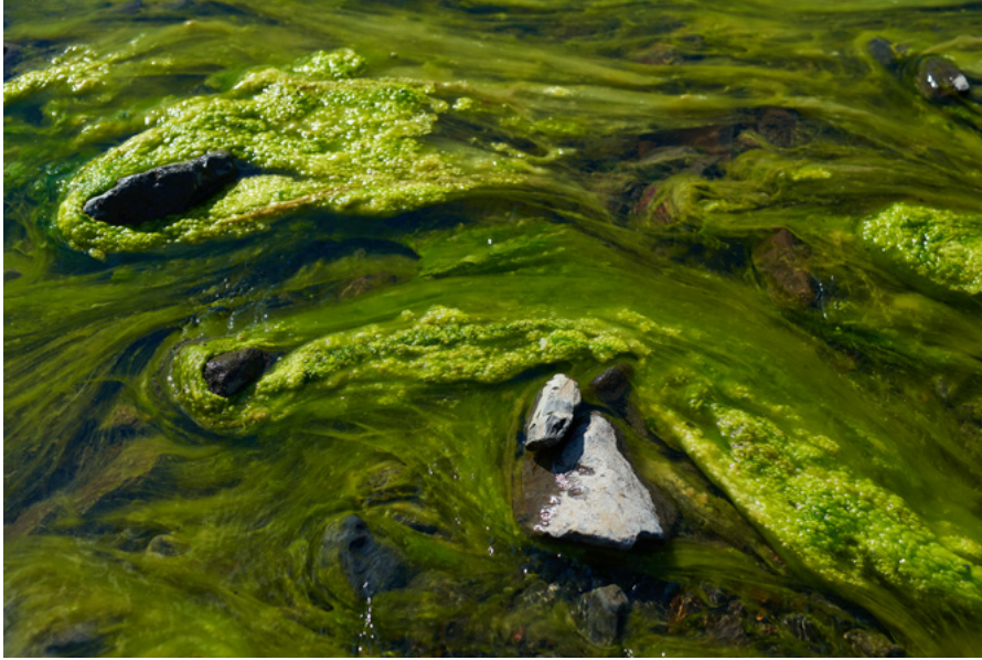
Breiðdalsvík, Islande, août 2021