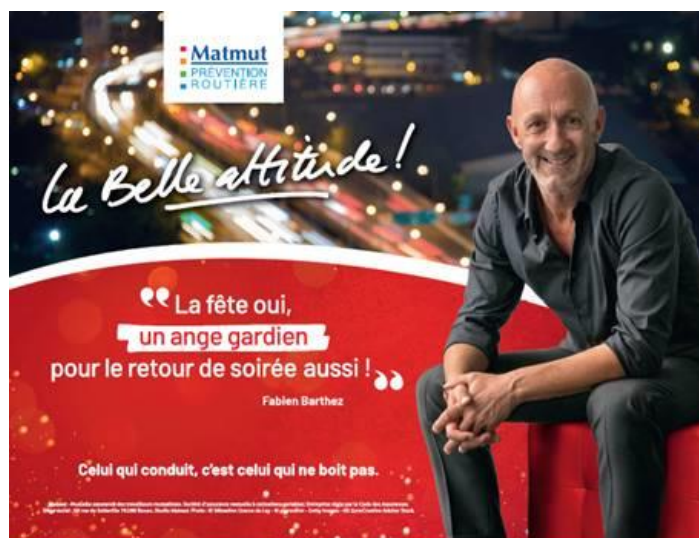
Campagne d'affichage « La Belle attitude ! » pendant les fêtes de fin d'année

« La fête oui, un ange gardien pour le retour de soirée aussi ! ». Le message qui s'affichera, durant la dernière semaine de l'année, sur plus de 600 écrans digitaux et panneaux, dans plus de 200 villes, sur les axes routiers les plus fréquentés est adapté à cette période de fête, lors de laquelle la conduite après avoir consommé de l'alcool, qui plus est de nuit, peut être particulièrement dangereuse. Le message est clair : celui qui conduit, c'est celui qui ne boit pas.